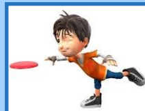
Cliquez sur l'image

Séance de DNL en EPS à l'école Bel Air de Torcy en classe de CM1 (vidéo et fiche de préparation)