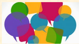
Cliquez sur l'image

Un grand merci aux collègues qui nous ont envoyé leurs productions en langues réalisées pendant l'année 2021-2022.